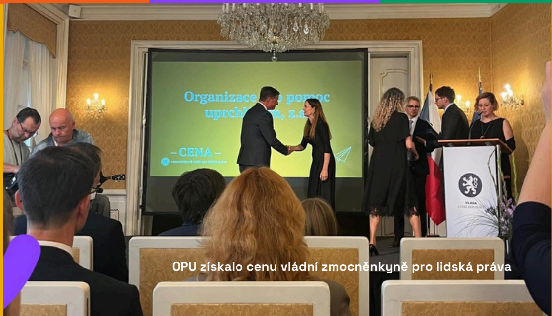
OPU získalo cenu vládní zmocněnkyně pro lidská práva

Projekt je zaměřený na podporu zaměstnatelnosti osob sociálně vyloučených a sociálním vyloučením ohrožených z řad cizinců na území města Ostrava.