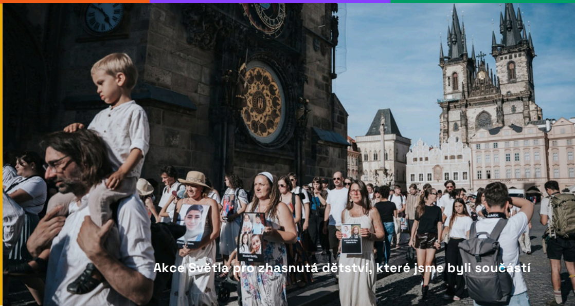
Akce Světla pro zhasnutá dětství, které jsme byli součástí

Účelem projektu je udržet a zvednout profesionální úroveň komunikačních procesů směrem k veřejnosti.