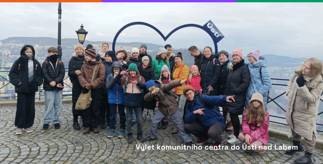
Výlet komunitního centra do Ústí nad Labem

Cílem projektu je zajistit systematizovaný a bezplatný přístup k odbornému právnímu poradenství cizincům nespĺňujícím podmínky vstupu či pobytu v ČR zejména v řízeních o správním vyhoštění, zajištění a návratu či řízení o povinnosti opustit území.