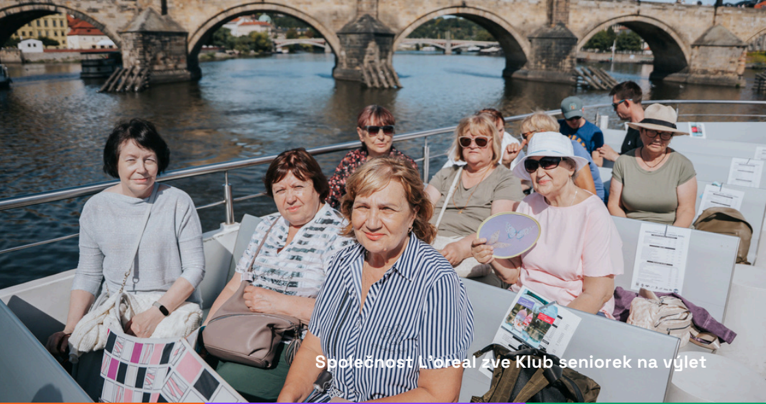
Společnost Loreal zve Klub seniorek na výlet